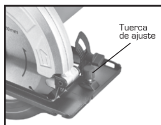
FIGURA 2 (Ajuste de altura de corte)