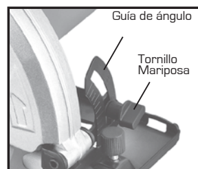
FIGURA 3 (Ángulo de corte)