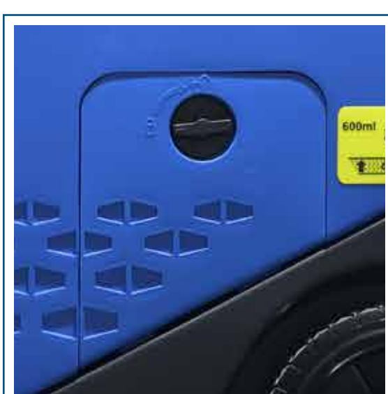
Nivel de aceite