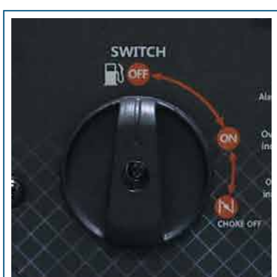
Cebador y paso de combustible