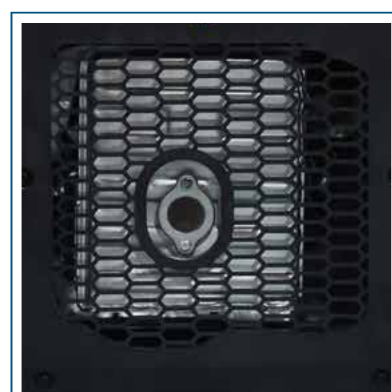
Salida de escape