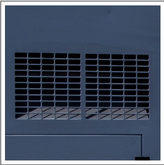
Ductos de ventilación