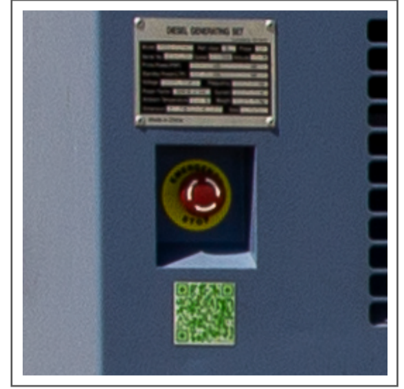
Botón de emergencia