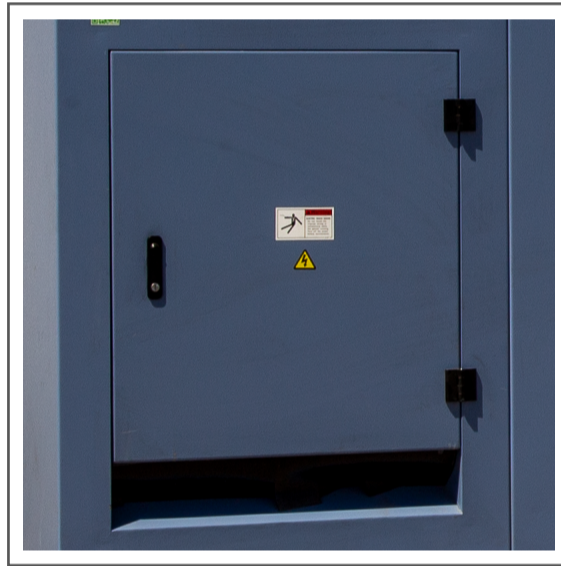
Bornera de conexión