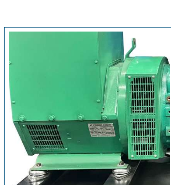
Alternador sin escobillas