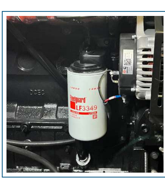
Filtro de aceite