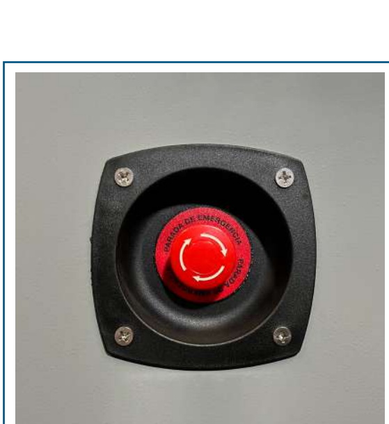
Parada de emergencia externa