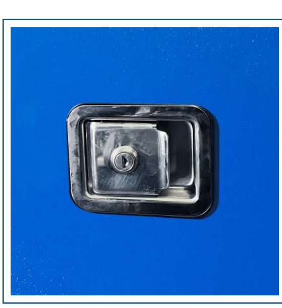
Cerraduras de acero inoxidable