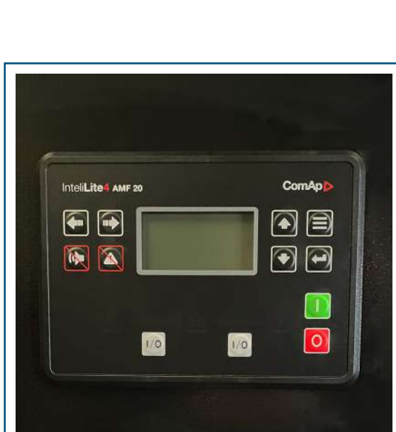
Tablero digital ComAp