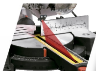
CON GUÍA LÁSER