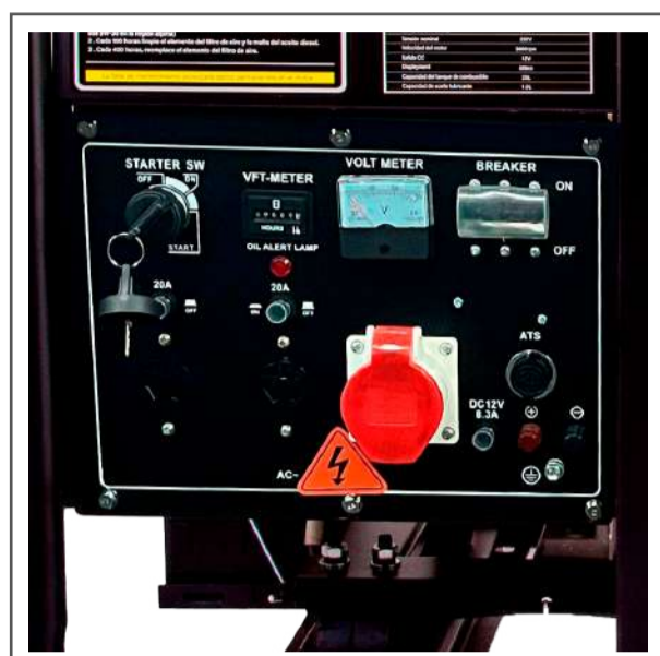
Tablero de conexión