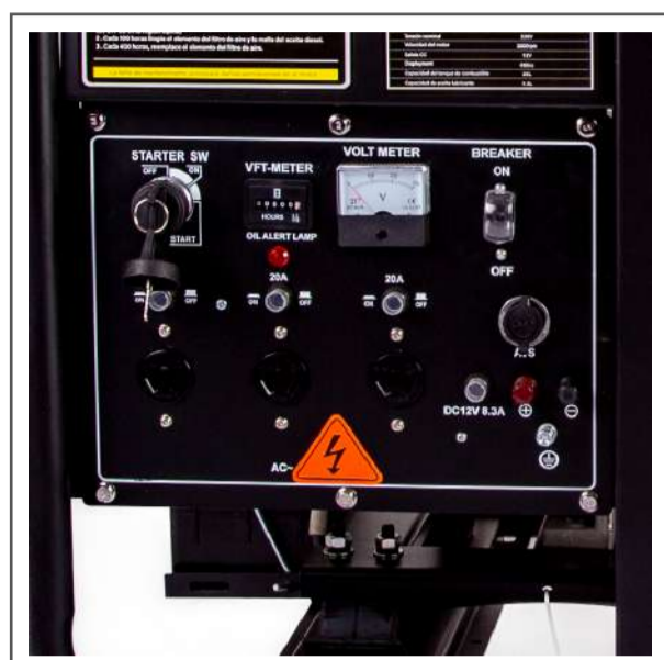
Tablero de conexión