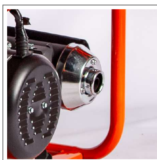
Caño de escape