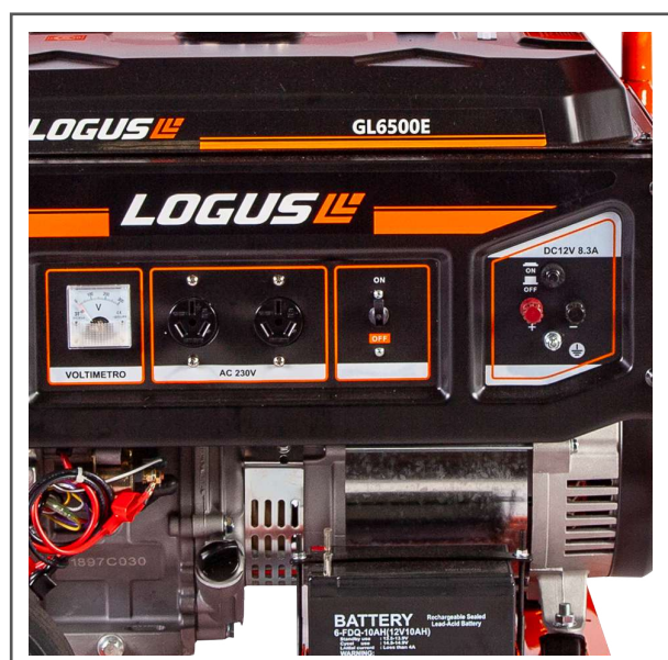
Panel de conexión y salida de 12V