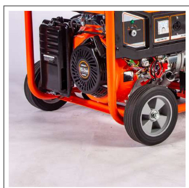
Ruedas y manijas de traslado