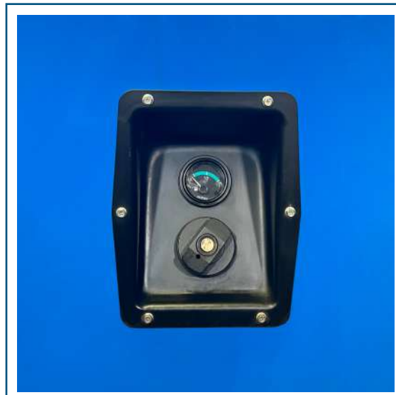
Carga de combustible externa con medidor