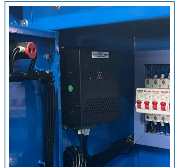
Cargador de batería