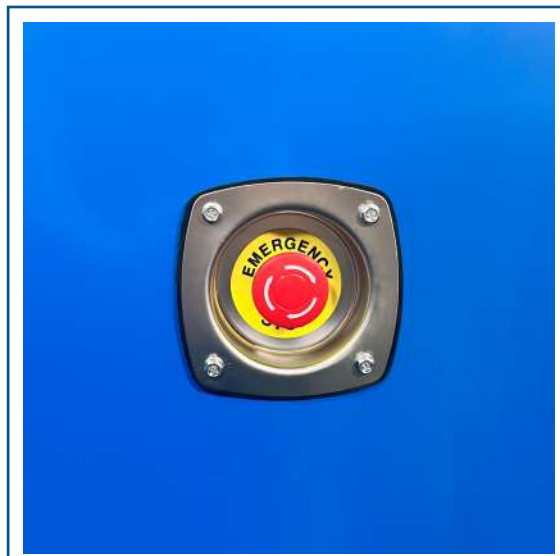
Parada de emergencia