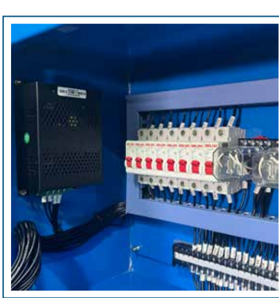
Cargador de batería