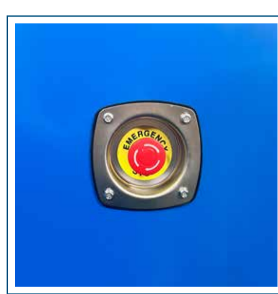
Parada de emergencia