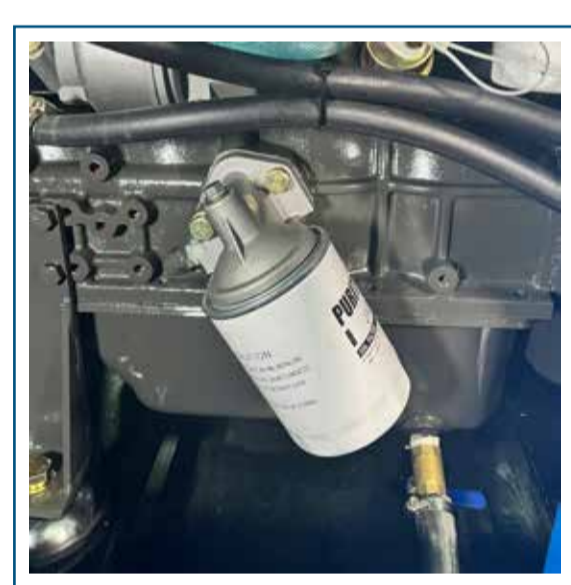
Filtro de aceite