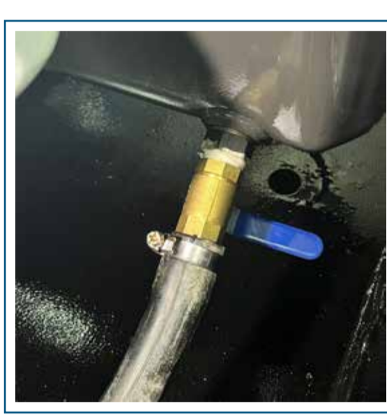
Desagote de aceite motor