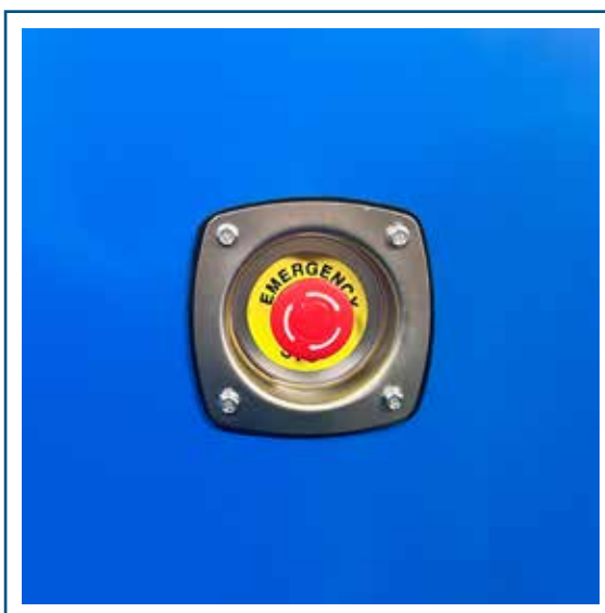
Parada de emergencia