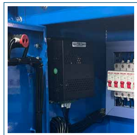
Cargador de batería