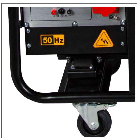
Bornera de conexión