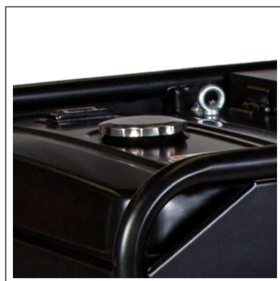
Medidor de combustible