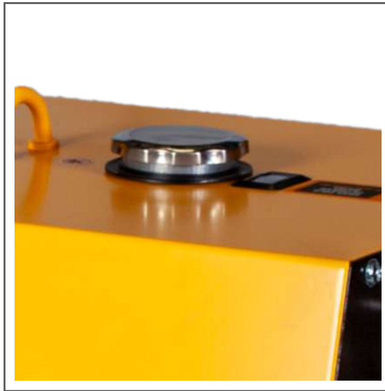
Carga de combustible y medidor