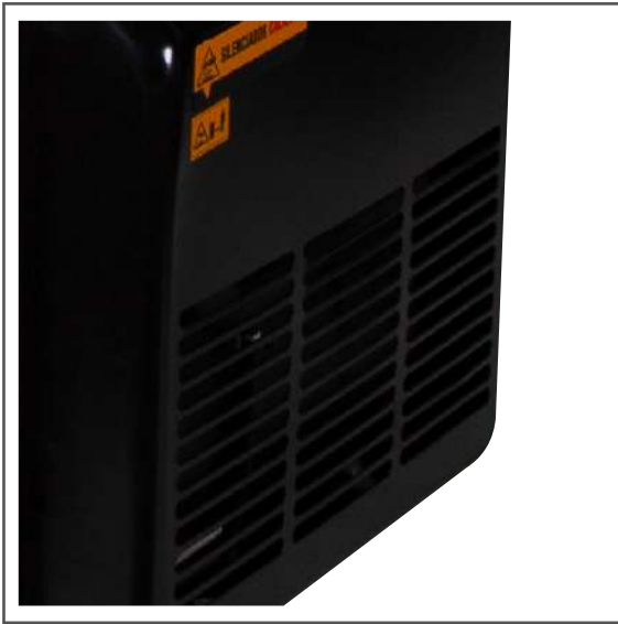
Salida de escape