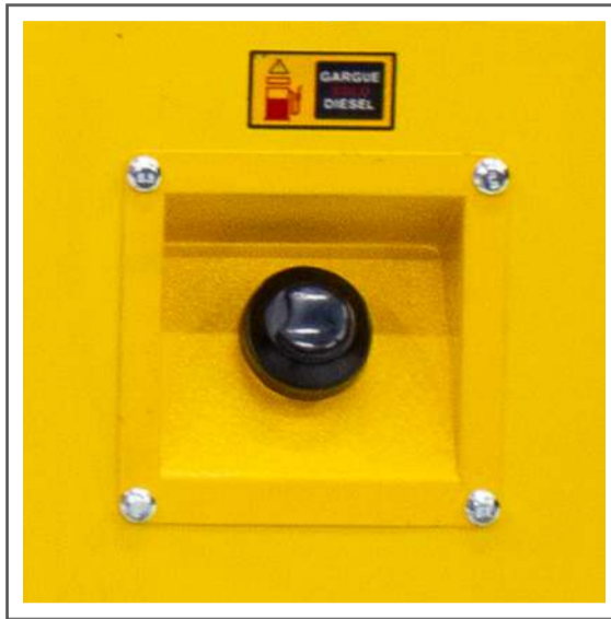
Carga de combustible