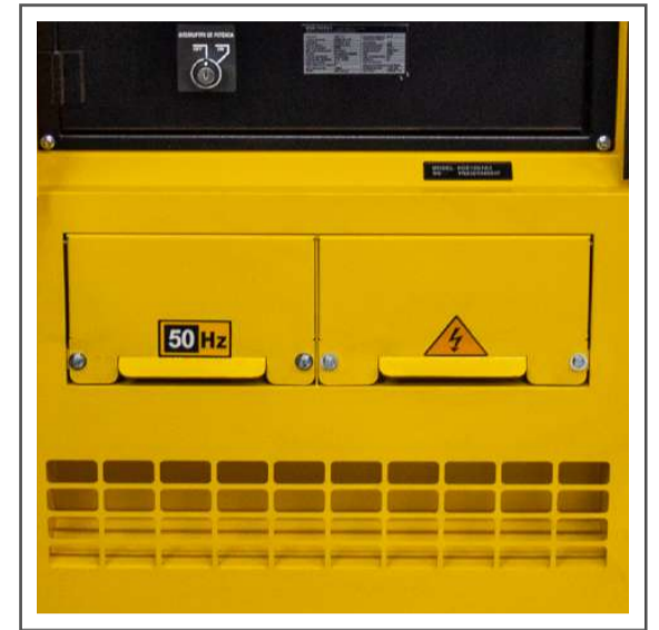
Bornera de conexión