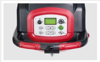
Panel de control intuitivo con pantalla LCD