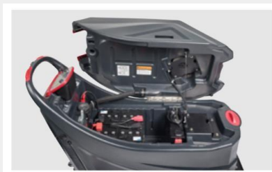
Depósito de recuperación con asa para facilitar la inclinación

La AS 7690T prioriza el rendimiento inteligente, el diseño sencillo, facilidad de uso en zonas de superficies medianas y grandes.